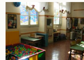
Aula attrezzata per gli alunni diversamente abili

Mensa autogestita: interna all'istituto.